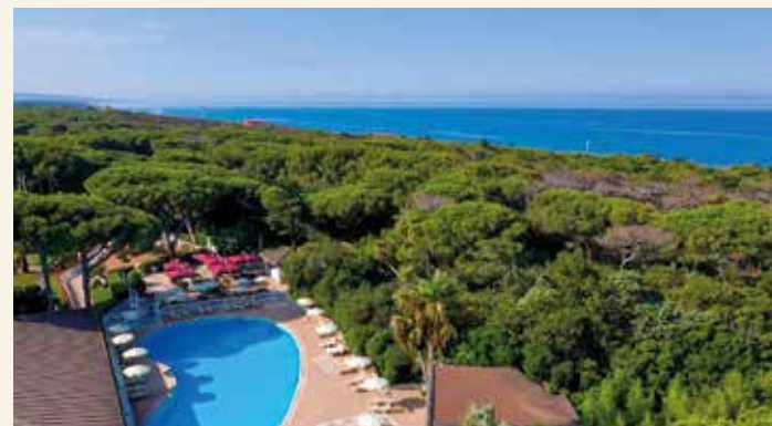
Unser Hotel liegt naturnah im Grünen