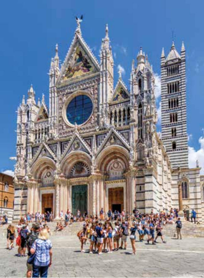
Filigrane Domfassade mit Marmorverzierung