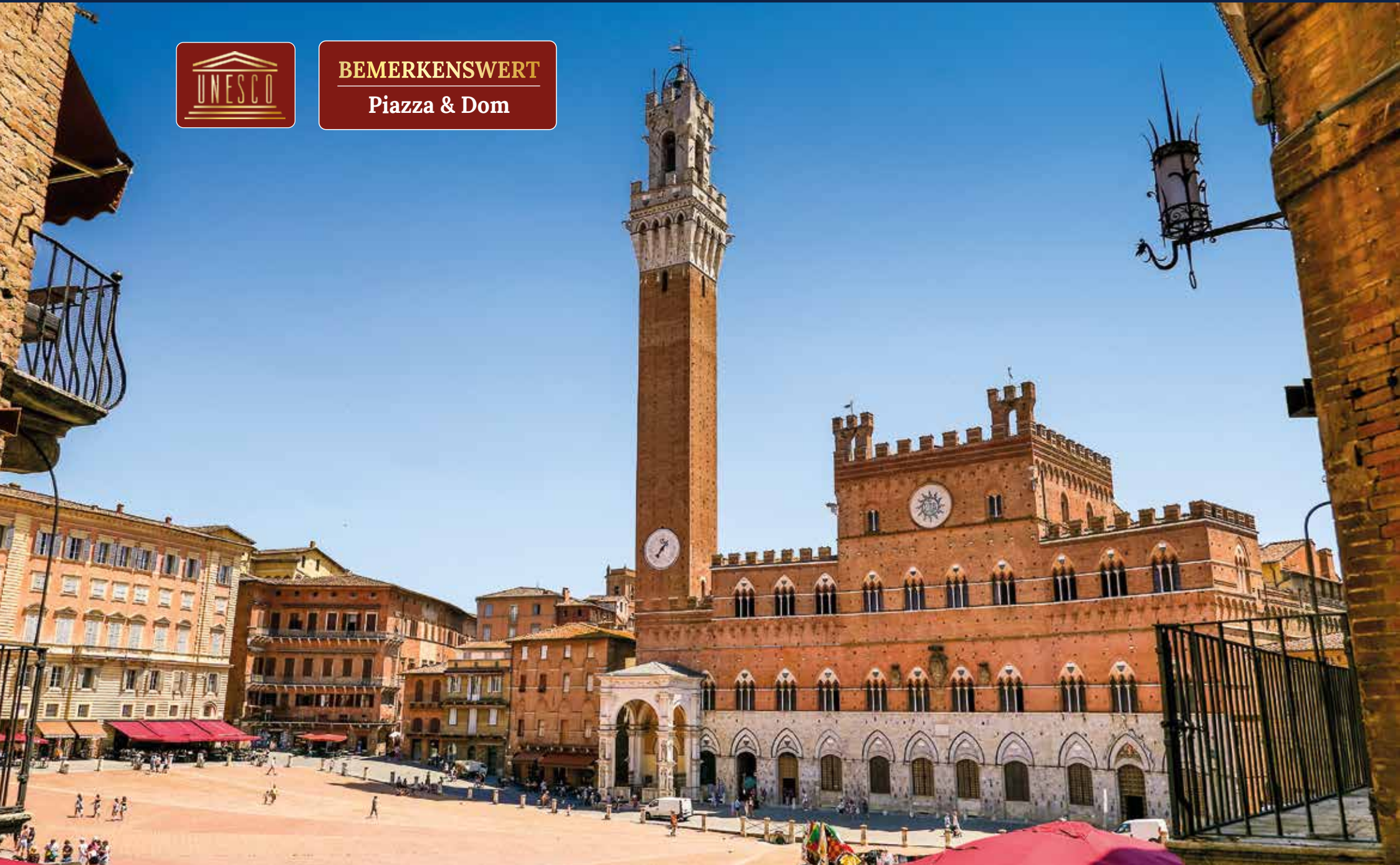
Die muschelförmige Piazza del Campo mit dem Palazzo Pubblico und dem Torre del Mangia bildet das historische Herz von Siena