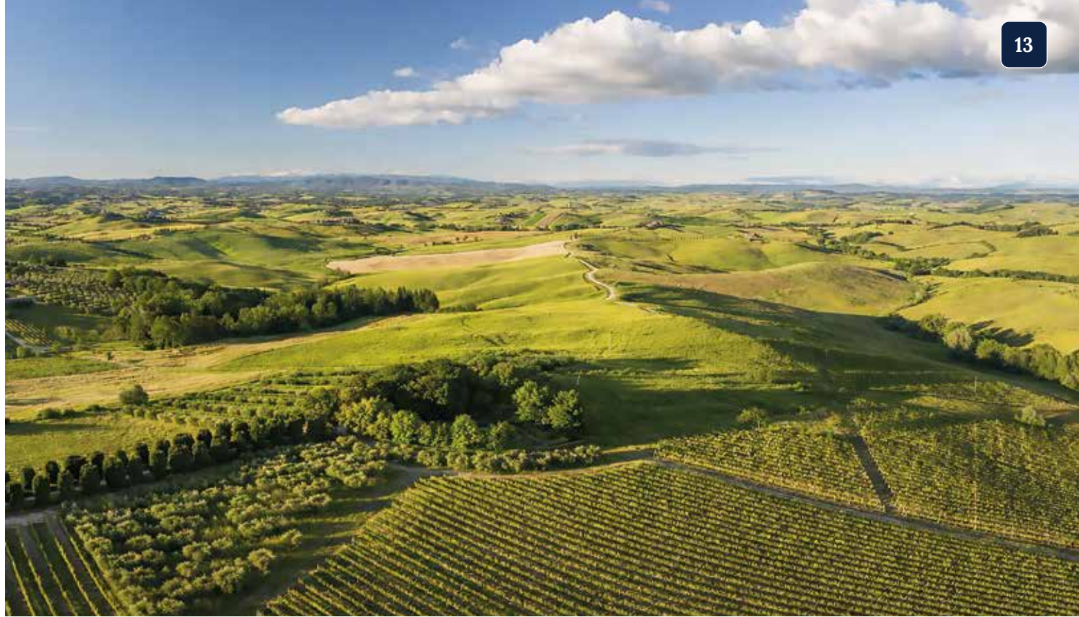
Sanfte Hügel und Weinberge formen die unverwechselbare Landschaft der Chianti-Region