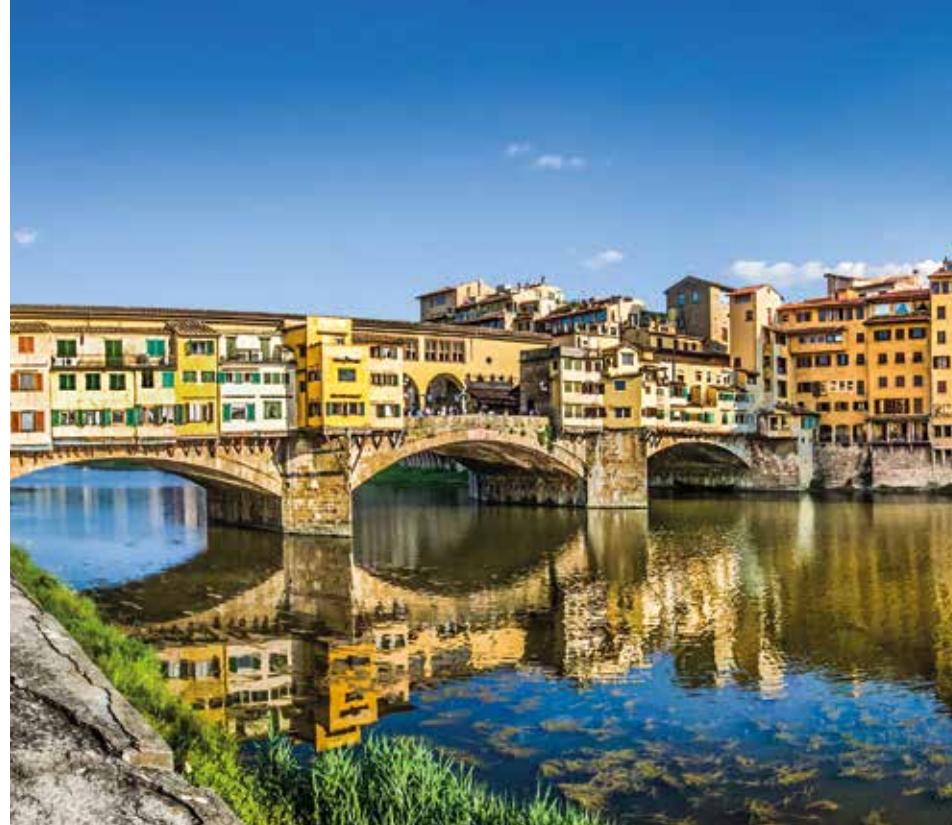
Historische Brücke Ponte Vecchio – bekannt für ihre Goldschmiedeläden