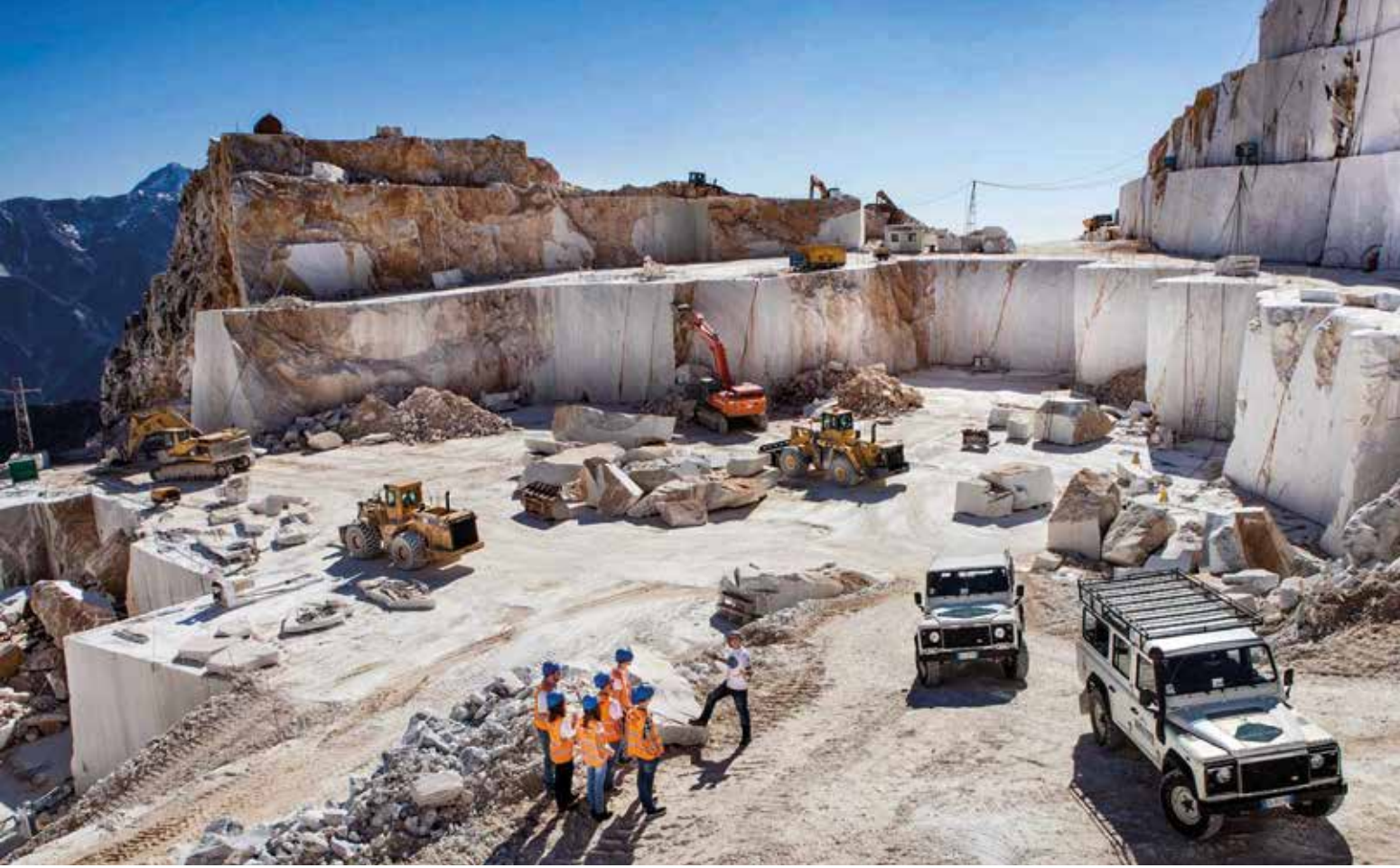
Wir betreten eine einzigartige Umgebung, die sonst nicht zugänglich ist – Bauhelme sorgen für unsere Sicherheit

Seit der Römerzeit liefern die weißen Marmorberge von Carrara das Material für weltberühmte Werke wie Michelangelos Statue „David“ und bedeutende Bauwerke wie den Petersdom in Rom. Unterhalb der Steinbrüche steigen wir in geländegängige Autos, die uns durch einen Tunnel in das aktive Abbaugelände von Fantiscritti bringen. Dort teilen wir uns auf: Im Wechsel besucht eine Gruppe das Steinbruchmuseum, die andere startet zu einer etwa 40-minütigen 4x4-Tour im Jeep oder Minivan. Zwischen modernen Maschinen und gewaltigen Marmorblöcken erleben wir die Dimensionen, in denen das „weiße Gold“ gefördert wird.