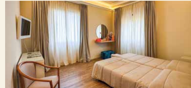
Unsere Doppelzimmer variieren im Design

HolidayCheck: „99 % Empfehlung“, Stand: März 2026