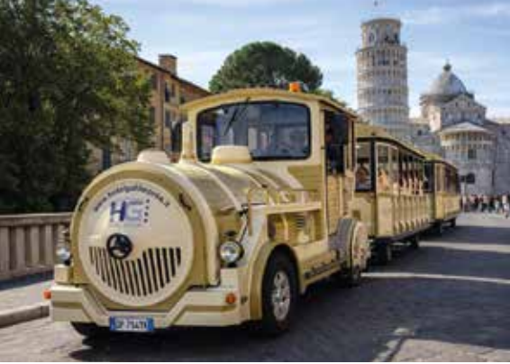
Transferfahrt mit dem kleinen Stadtbahn