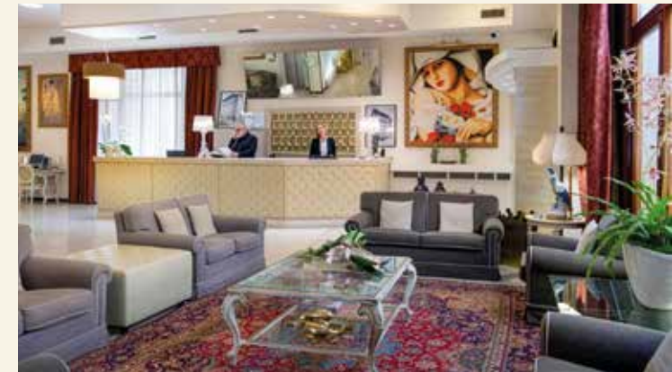
Stilvoller Empfangsbereich unseres Hotels