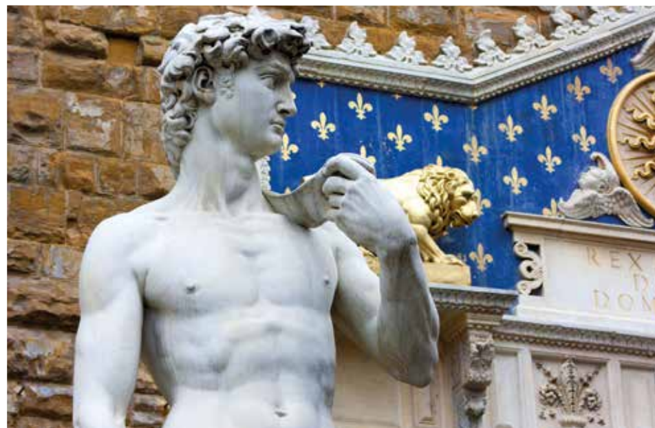
Palazzo Vecchio mit dem Arnolfo-Turm und einer Replik der berühmten Michelangelo-Statue „David“