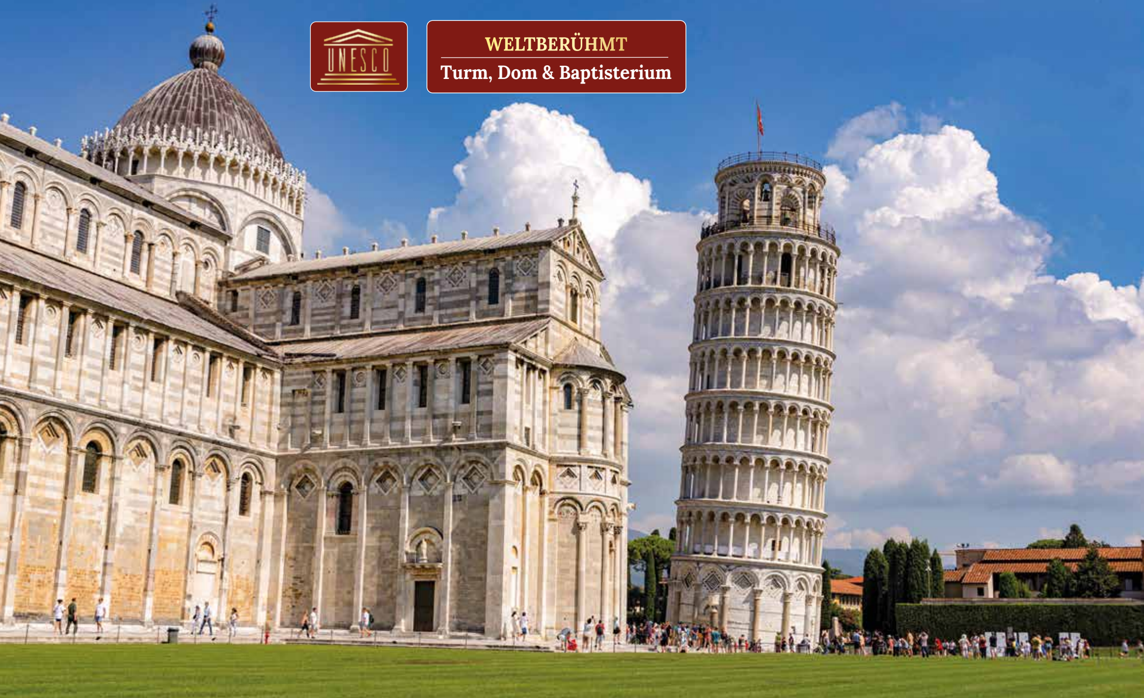
Der rund 56 Meter hohe Schiefe Turm von Pisa prägt seit dem 12. Jahrhundert das historische Ensemble am Domplatz