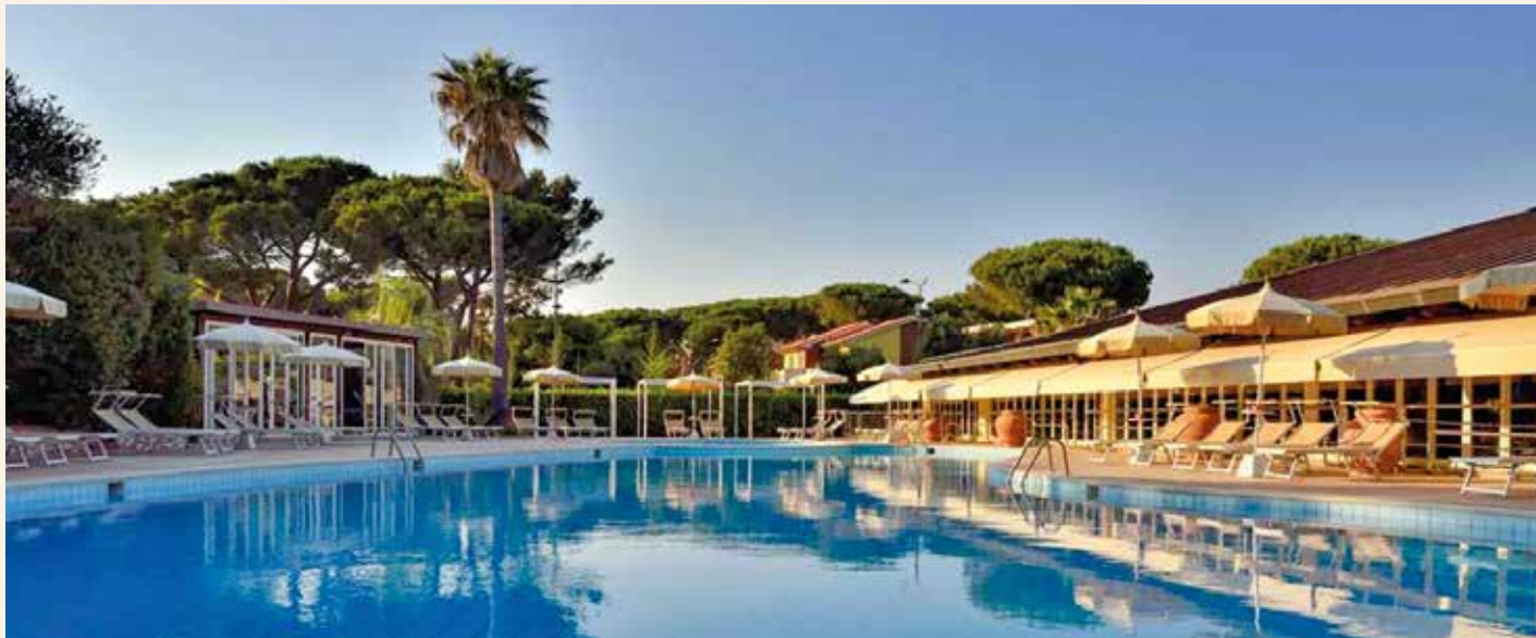
* Poolanlage inmitten einer mediterranen Gartenanlage

Booking.com: „Fabelhaft“, Stand: März 2026