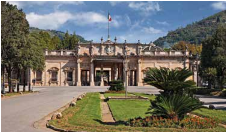
Beeindruckende Terme Tettuccio am Stadtpark