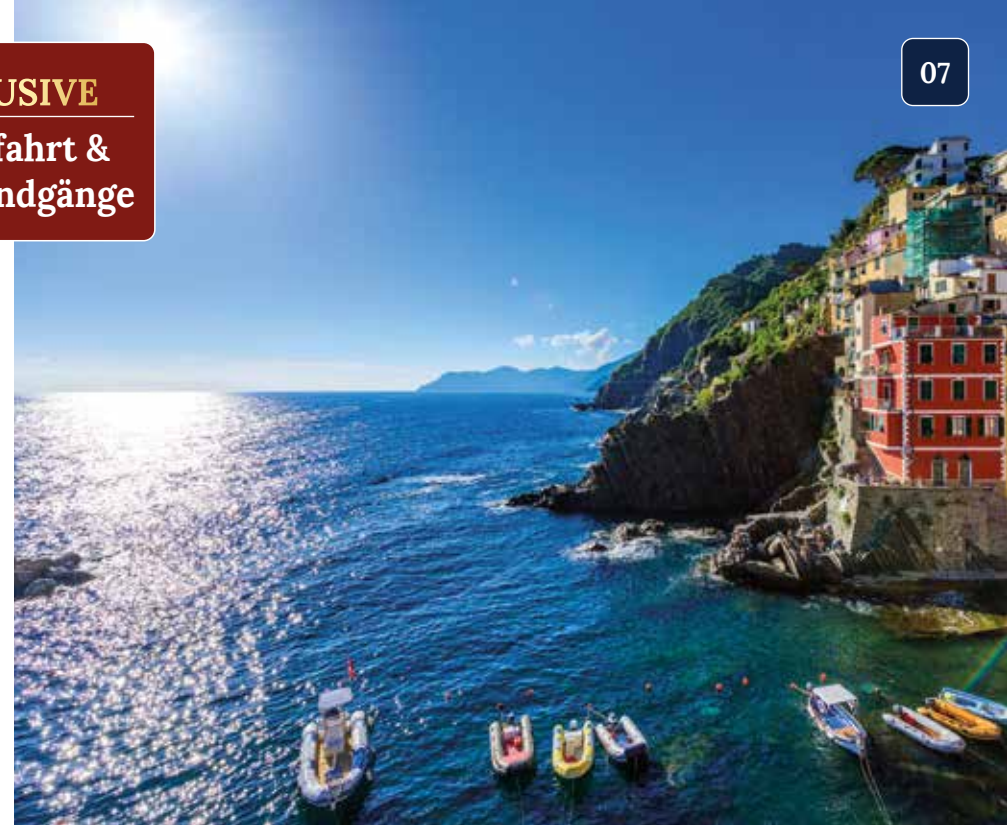
Schiffahrts-Panorama: bunte Dörfer und steile Felsenklippen