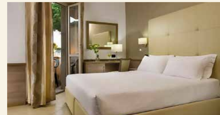
Komfortable Zimmer mit Balkon und Blick ins Grüne