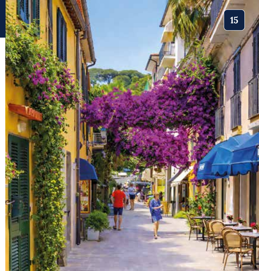
Freizeit zum Flanieren im pittoresken Porto Azzurro