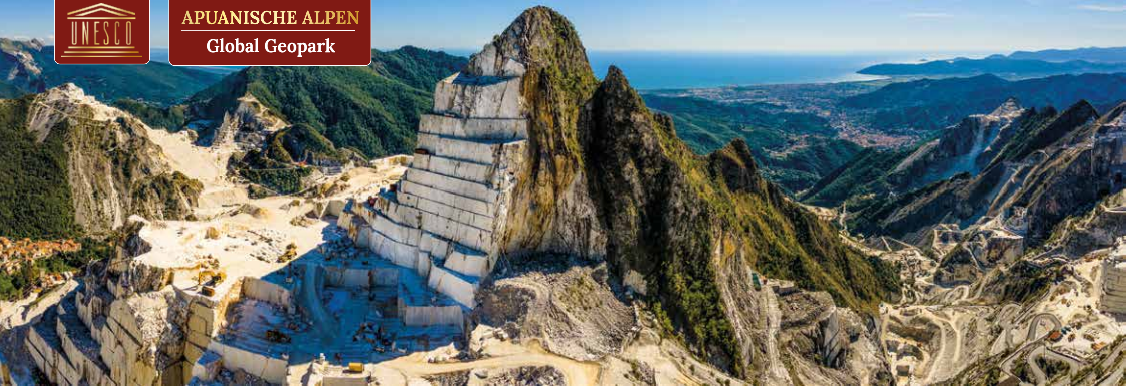
Die weißen Terrassen der Carrara-Steinbrüche gehören zu den spektakulärsten Landschaftsbildern Italiens