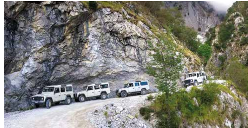
Uns erwarten atemberaubende Aussichten – ein Abenteuer in Geländefahrzeugen zwischen unbefestigten Straßen, Anstiegen, Abfahrten und Tunneln