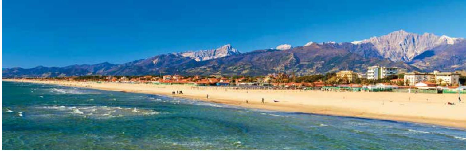
An einer Promenade der wunderschönen Versiliaküste verbringen wir etwas Freizeit

Die Spezialität Lardo di Colonnata ist ein luftgereifter Speck, der seit Jahrhunderten in Kübeln aus Carrara-Marmor reift. Ursprünglich war er eine kräftige Mahlzeit der Steinbrucharbeiter. Gewürzt mit Salz, Knoblauch und Kräutern, erhält er sein charakteristisches Aroma. In einem Restaurant nahe den Steinbrüchen genießen wir den traditionell zubereiteten Speck, der mit regionalem Käse, herzhaftem Gemüsekuchen und einem Glas Rotwein gereicht wird.