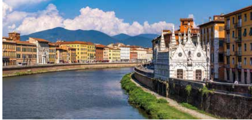
Filigrane Marmorkirche Santa Maria della Spina am Arno-Ufer