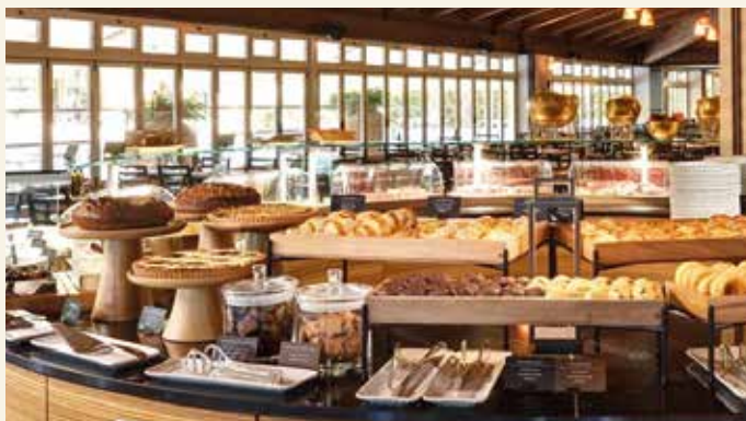
Buffet-Restaurant mit reichhaltiger Auswahl