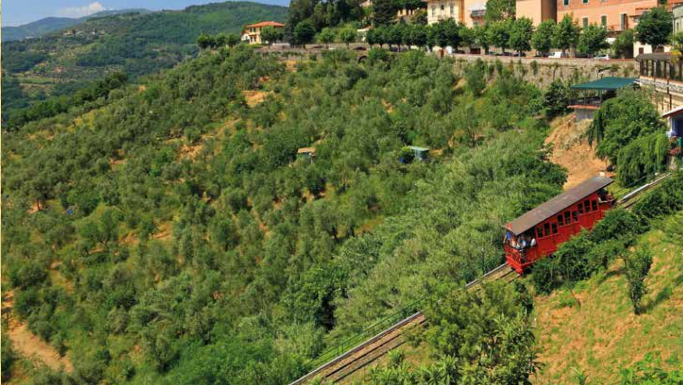
Freizeitipp: Fahrt mit der nostalgischen Standseilbahn zur oberhalb gelegenen Altstadt (gebührenpflichtig)