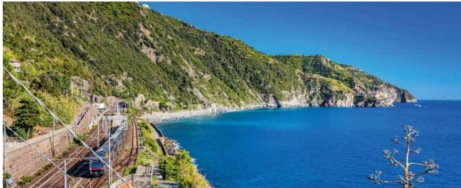
Zugfahrt entlang der ligurischen Steilküste – eine Strecke mit Meer, Felslandschaft und weitem Horizont